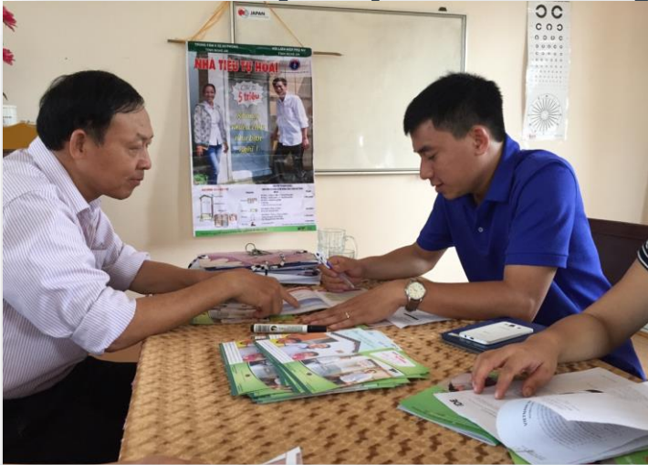
Cán bộ Y tế/Phụ nữ cấp huyện và xã – đàn ông và phụ nữ