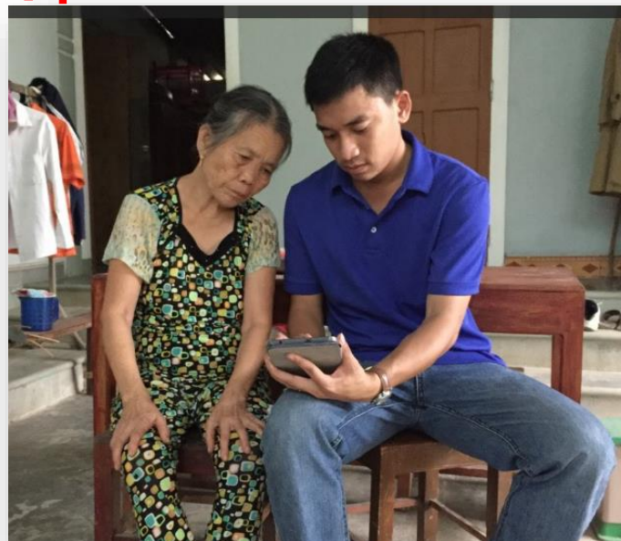
Hộ xây nhà tiêu, chưa xây nhà tiêu