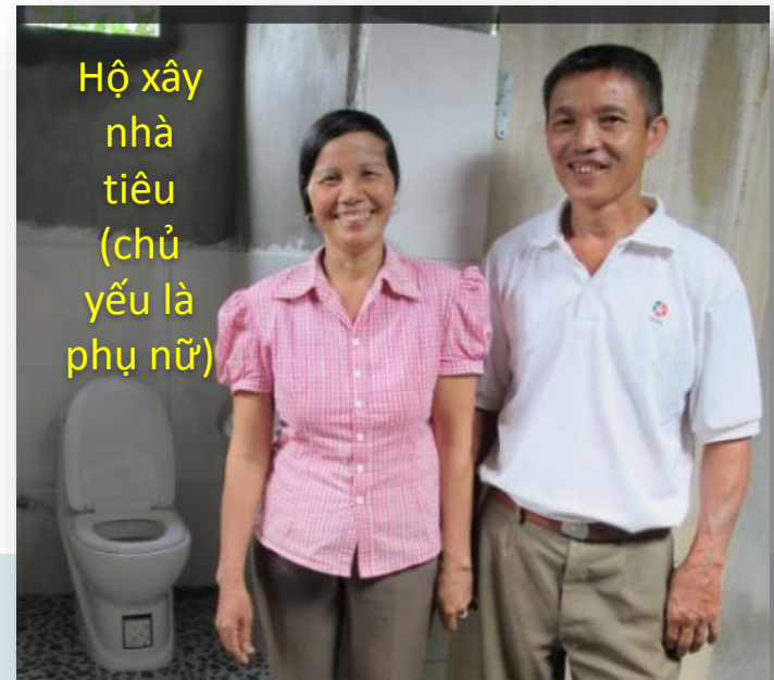
Hộ xây nhà tiêu (chủ yếu là phụ nữ)